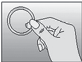
Figur 1. Tag NuvaRing ud af foliepakken