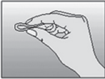
Figur 2. Klem ringen sammen.